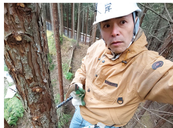
高所からの風景(10m弱)

この日は20人を超える隊員での活動となり、中には通算700回参加しているという強者もおられた。初めての高所での作業である為、指導員の方には一から教えてもらった。正味1本半分の杉の木を枝打ちを済ませられ、他の参加者の方に褒めてもらい有頂天になった。午後に、風が少し強く吹いた時には木がグワングワン揺らされてしまい、怖い瞬間もあった。ただ目の前の森と木と枝に向かい合い、また木登り器具の操作動作で一杯で、アウトドアのアクティビティーに参加したかの様に1日が過ぎていった。向き不向きのあるボランティアと思われるが、何よりも同じ志を持ち、普段は違う世界に生きる様々な方々と交誼の時間を持てた事。普段呑んでいる水道水の原点を少し見れた事が収穫である。作業後に頂いた水は確かにこの上なく柔らかく美味しかった。次回は森林の間伐を手伝いに行こう。