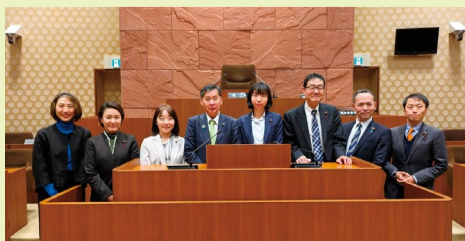
特別委員会メンバー@一関市議会議場