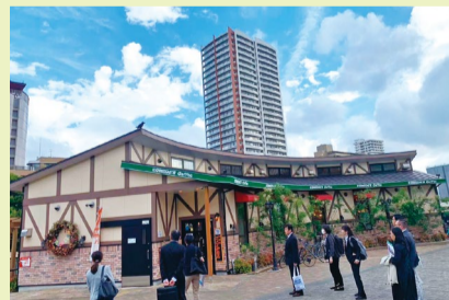
北九州市Park-PFIによる喫茶店誘致