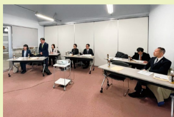
オガールプロジェクト意見交換会

●都市環境委員会にて北九州市(Park-PFI先行事例)・福岡市(一人一花運動)・久留米市(既存公共施設のZEB化)・大宰府市(オーバーツーリズムに伴う環境負荷)に伺い、各先行事例の調査に伺いました。