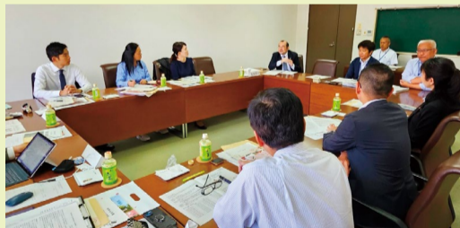
旧知の大宰府市長も参加してくれた意見交換

●都市環境委員会にて北九州市(Park-PFI先行事例)・福岡市(一人一花運動)・久留米市(既存公共施設のZEB化)・大宰府市(オーバーツーリズムに伴う環境負荷)に伺い、各先行事例の調査に伺いました。