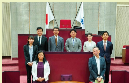
都市環境委員会メンバー@福岡市議会議場